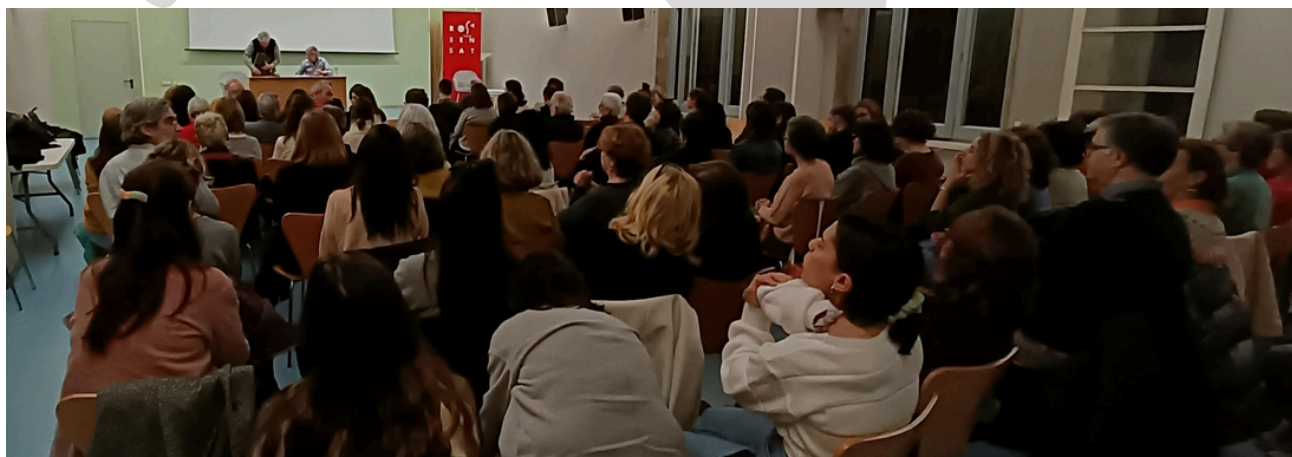
Públic assistent a la presentació del llibre.

Així mateix, han fet les seves aportacions altres professionals que van treballar anteriorment a l'escola i han deixat una important petjada, així com professionals externs que es van sumar a la iniciativa de reflexió col·lectiva. També hi ha alguns capítols finals redactats per persones que han exercit o exerceixen la funció de supervisors de la institució.